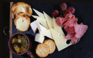
Charcuterie and Cheese Board