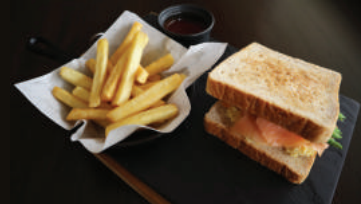
Toast to Toasted