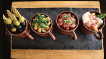
Elephant Bar Combo