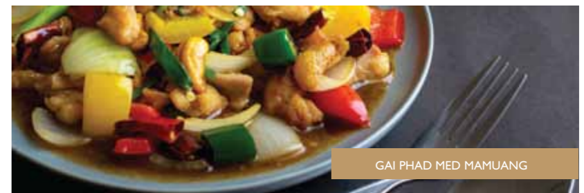
GAI PHAD MED MAMUANG

Stir-fried chicken with cashew nuts and vegetables