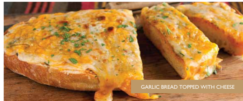
GARLIC BREAD TOPPED WITH CHEESE